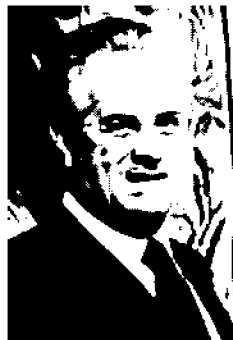
Ministro Claudio Scajola